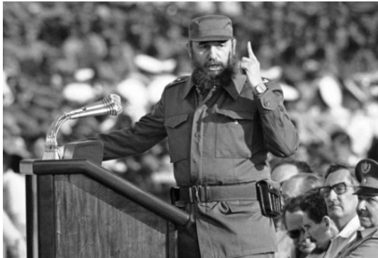
Fidel Castro.

Un análisis de la Universidad de Navarra señala que más de un millón de cubanos abandonaron la isla desde mediados de 2021 debido a la crisis y la represión.