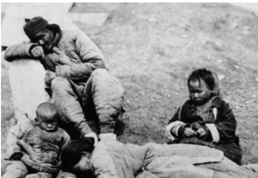
La gran hambruna en la China de Mao.

El régimen de Mao provocó más de 70 millones de muertes en tiempos de paz, lo cual lo convierte en responsable de 38 millones de personas que murieron de hambre y sobreexplotación en el Gran Salto Adelante, y de al menos 45 millones de personas que fueron explotadas, hambrientas o golpeadas hasta la muerte.