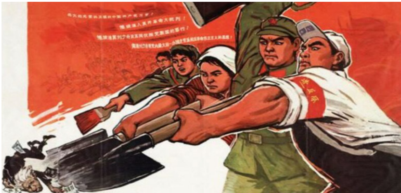
Afiche de la Revolución Cultural.