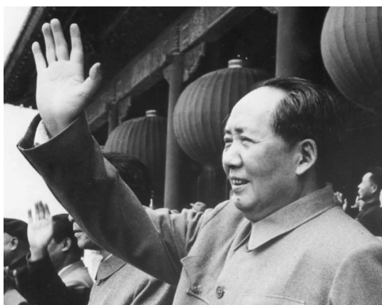
Mao Zedong