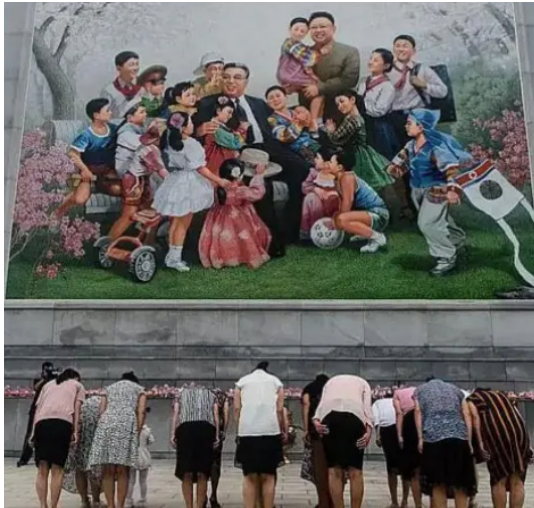
Transeúntes se inclinan ante un mosaico en Pyongyang que muestra al padre y al abuelo de Kim Jong-un.

Aún cuando algunos movimientos comunistas contemporáneos renuncien explícitamente a la violencia, no pueden desligarse de su origen ni de la trayectoria de los regímenes que implantaron el comunismo en el siglo XX.